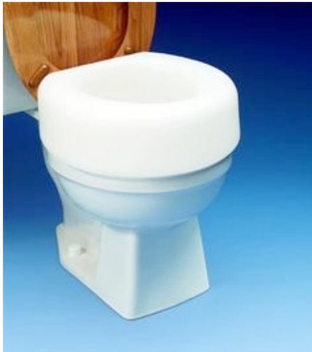
11. Σταθερή καρέκλα μπάνιου