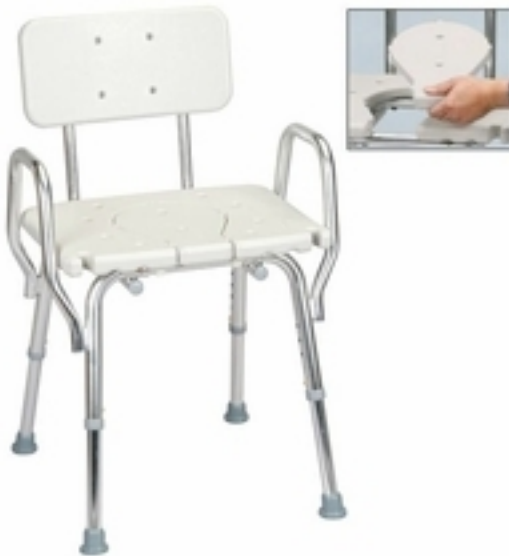
12. Περιστρεφόμενη καρέκλα μπάνιου