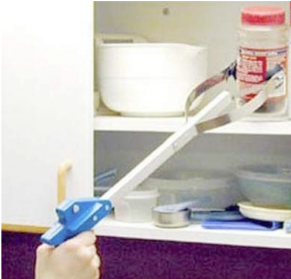
14. Ανυψωτικό Μαξιλάρι για το αμάξι